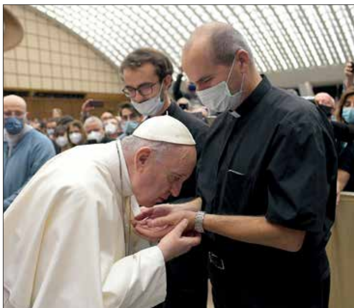
☛ Děkovná pouť novokněží z ČR říjen 2020, setkání s papežem Františkem ve vatikánské Aule Pavla VI.