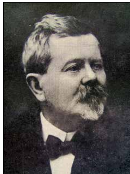
( Pražský varhanář Emanuel Štěpán Petr (1853–1930)

Nástroj z roku 1890 (opus 45) má celkem 26 rejstříků a Emanuel Štěpán Petr jej instaloval v neuvěřitelně krátkém čase – za jeden a půl měsíce. To svědčí o velmi dobré logistice firmy. Nástroj má na rozdíl od jičínských varhan mechanickou trakturu a tento způsob ovládnutí je i po 130 letech