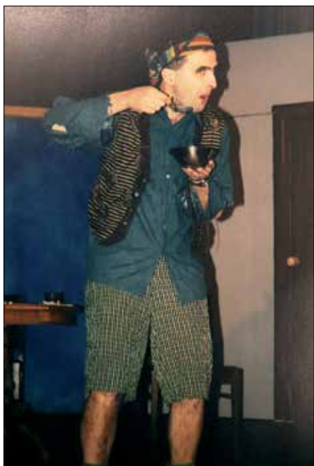
( V divadelní hře Sluha dvou pánů