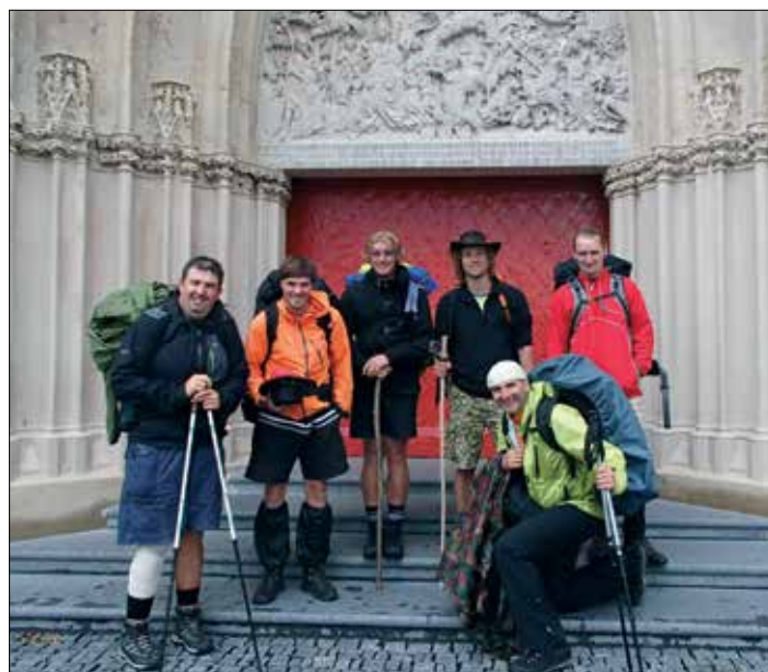
☛ Pěší pouť z Litomyšle do Mariazell