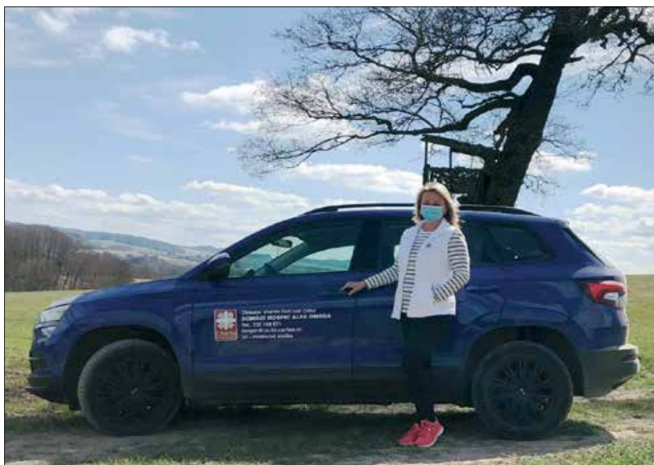
ⓘ Zdravotní sestřičky Domácího hospice Alfa-Omega Ústí nad Orlicí dojíždí k těžce nemocným a pomáhají jejich rodinám s péčí i v době covidové.

Doprovázení umírajícího je náročná, 24hodinová služba. Odložit své potřeby a věnovat se pouze jemu. Svě o tom ví