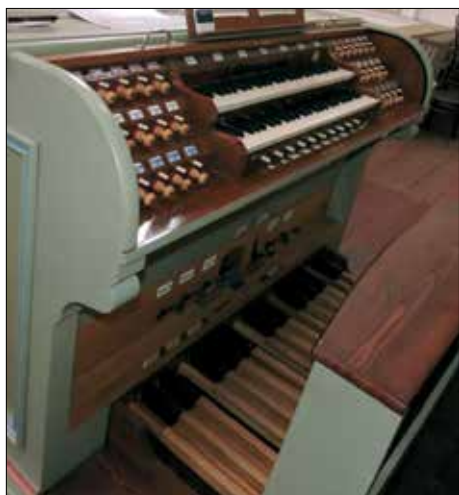
( Jičín, hrací stůl

Dvoumanuálový nástroj se 30 rejstříky postavil jeden z nevýznamnějších