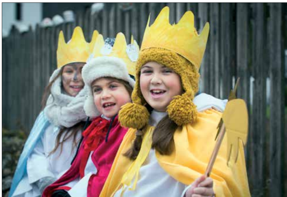
Online koledníci budou letos rozdávat radost a pomáhat až do Velikonoc na webové stránce www.trikralovasbirka.cz .

Pokud jste v lednu online koledu propásli, tak nezuťejte. Online koledníci budou rozdávat radost a pomáhat na www.trikralovasbirka.cz až do 30. dubna.