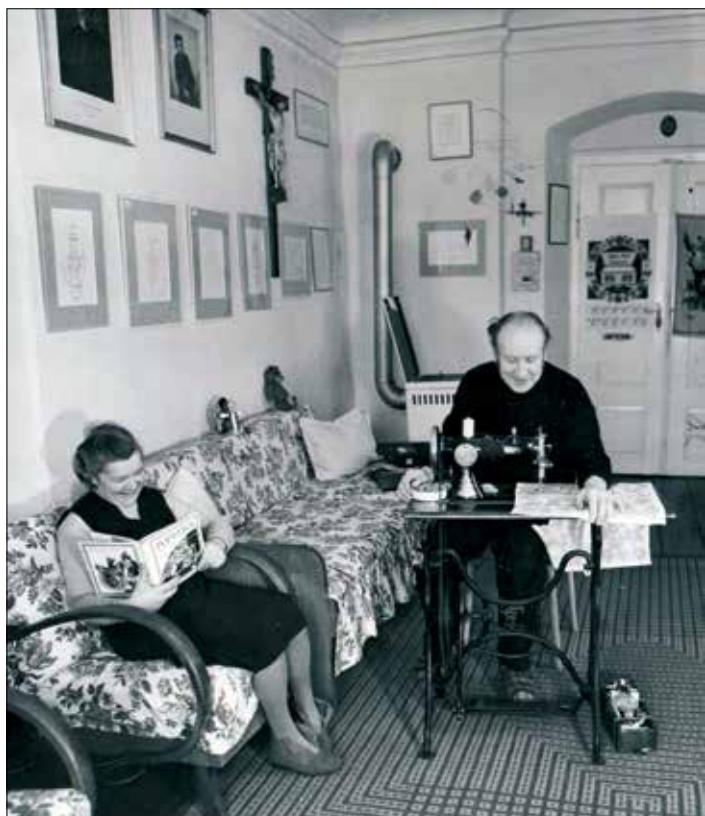
Idyla na faře, kde se každý cítil přijatý a vítaný