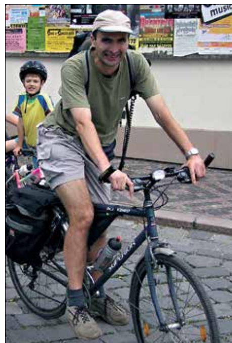
( Na cestě do Končin u Litomyšle