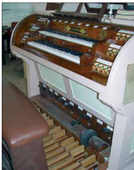
Hořice, hrací stůl

Všeobecně lze říct, že na nástroje Em. Š. Petra nejlépe vyzní hudba romantická. Zejména u těch větších nástrojů, jako jsou zde v Hořicích nebo v Jičíně, má varhaník k dispozici bohatý výběr rejstříků, vhodných právě pro hudbu z období