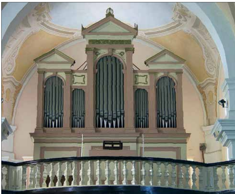
Hořice, pohled na varhany