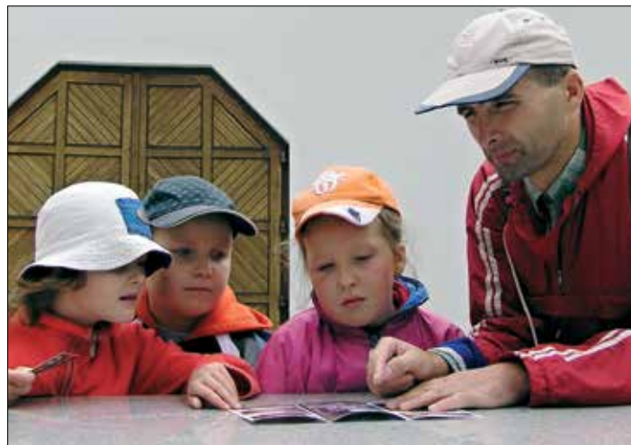
( Na dovolené s rodinami v Jeseníkách

byla opravdová svatba i s patřičnou oslavou v Litomyšli. Rodiče měli ze mě radost.