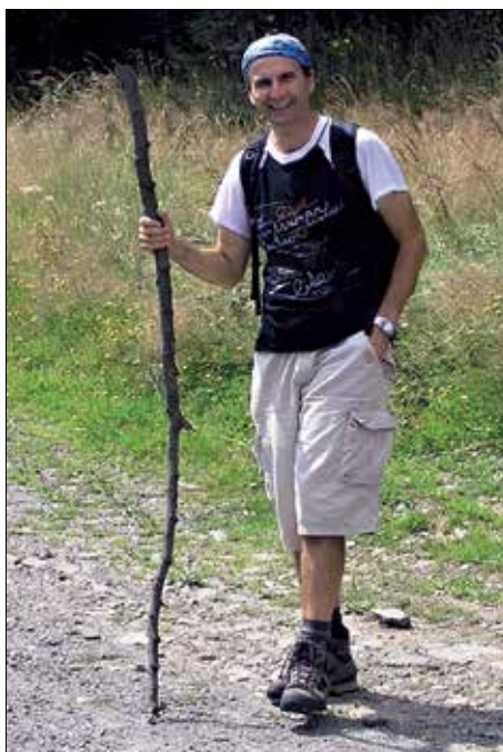
( Dovolená v Beskydech