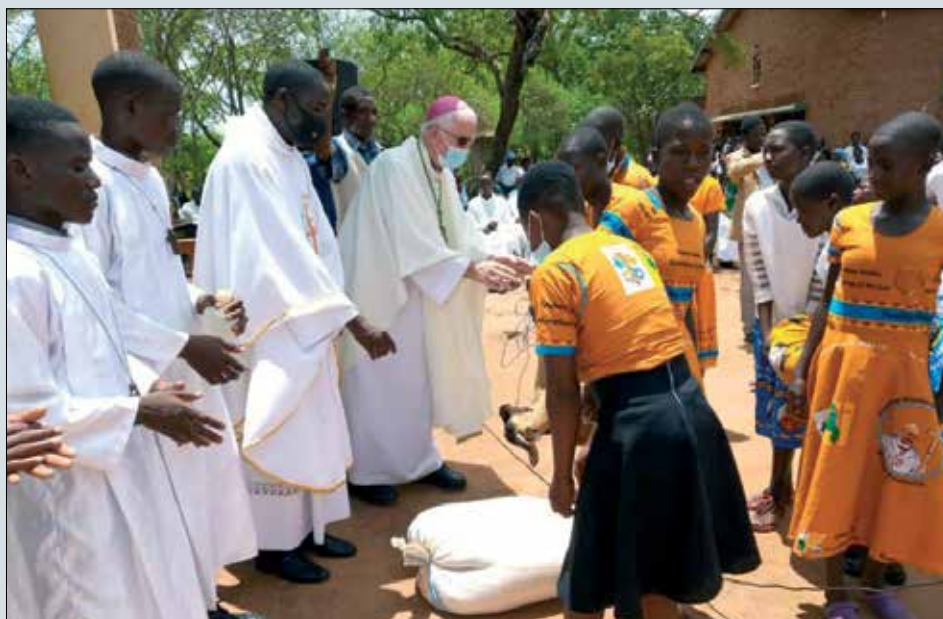
Malawi – biřmování ve farnosti sv. Františka v arcidiecézi Lilongwe

6. ledna proběhl celosvětový svátek Papežského misijního díla dětí. V diecézi Mzumzu oslavili tento den mši svatou a následně děti z Papežského misijního díla dětí předaly dary a potřebné věci spoluobčanům na venkovské dětské klinice. Ve spolupráci s dárci z České republiky zde papežské misie pomáhají zvláště sirotkům a chudým, podporují výdaje na hygienu, léky, uniformy a vzdělání.