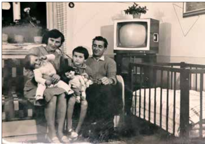
( S rodiči a se sestrou