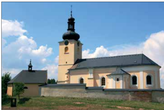
Farní kostele sv. Filomény a sv. Jakuba v Koclířově