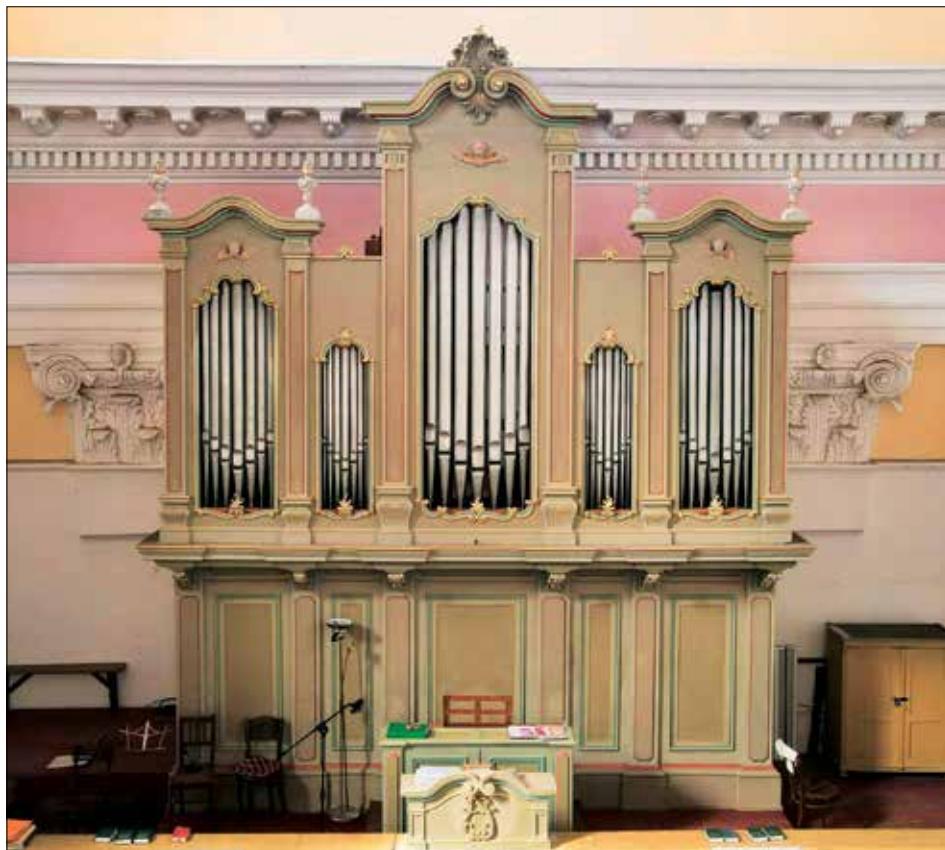
⊣ Jičín, pohled na varhany

tím, že každý rok se nepodařilo sehnat potřebné finance, a také tím, že se v Jičíně v posledních letech často střídal administrátor farnosti, a ne každý měl sílu v tak náročné akci pokračovat. Farnost totiž paralelně restaurovala varhany i ve Veliši a Ostružně, a ve všech případech se rozpočet pohyboval kolem 2,5 milionů korun. O to větší dík patří stávajícímu duchovnímu správci otci Prokopu Tobkovi za to, že tuto odvahu a energii měl a opravu v Jičíně dotáhl do zdárného konce.