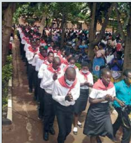
Malawi – misijní den dětí

Tento rok je poznamenán na celém světě epidemií koronaviru. Zde jsme víceméně v karanténě už sedm měsíců a nikdy jsme nemohli obnovit mše a “normální” farní činnost. Nemohu říci, že se vláda nesnaží řešit situaci pandemie. Ale je poznat, že celková organizace je na úrovni rozvojové země. Mexiko má 130 milionů obyvatel, téměř milion infikovaných a skoro 100 000 úmrtí – což je velice vysoký počet.